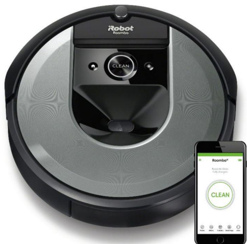
Der Neue: Roomba® i7 mit iRobot® HOME App

Absaugstation. Durch dieses neue Feature wird nun auch die Entleerung automatisiert, sodass Nutzer sich wochenlang nicht mehr mit dem Staubsaugen beschäftigen müssen. Mit Imprint™ Smart Mapping lernt der Roomba® i7+ Saugroboter den Grundriss kennen und unterscheidet zwischen den einzelnen Räumen. Der Roomba® i7+ kann bis zu zehn Grundrisse speichern, so dass er das Obergeschoss vom Untergeschoss unterscheidet. Die Intelligente Kartierung ermöglicht es dem Nutzer ausserdem Räume in der Smart Map zu benennen und über die iRobot HOME App gezielt einzelne Räume für die Reinigung einzuplanen. Der iRobot® Roomba® i7+ wird ab dem 15. Februar 2019 in der Schweiz verfügbar sein.