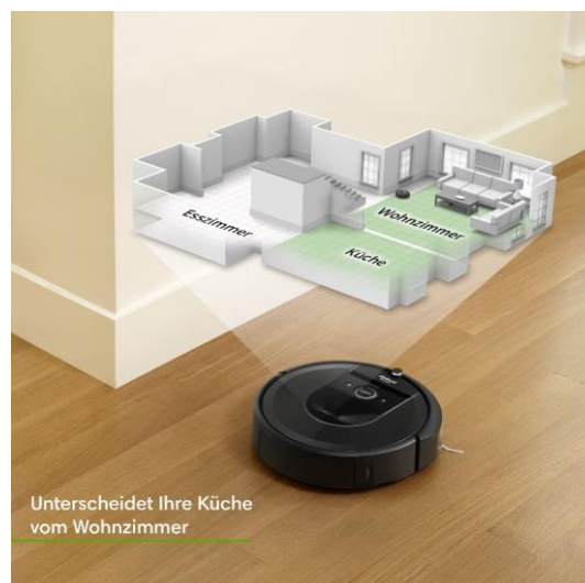
Unterscheidet Ihre Küche vom Wohnzimmer

iRobot® HOME App: Wann und wo der Reinigungsvorgang stattfindet entscheidet der Nutzer.