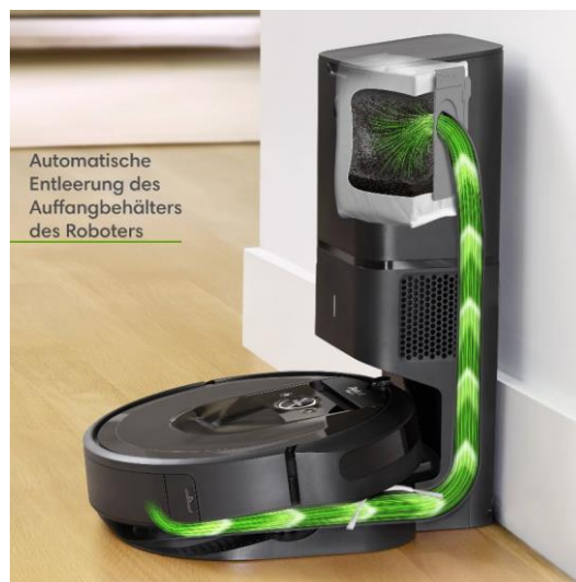
Automatische Entleerung des Auffangbehälters des Roboters